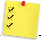
TABLEAU SYNTHÈSE FRAIS DU SERVICE DE GARDE